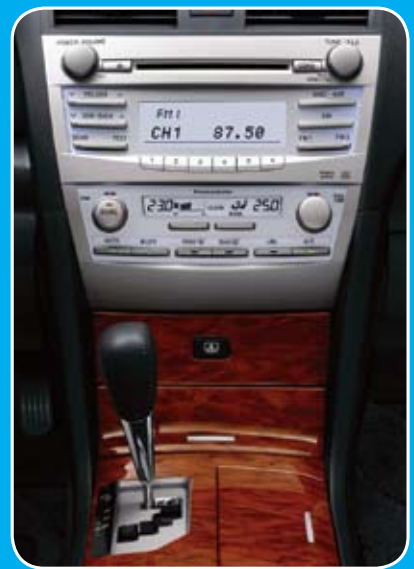
Hộp số tự động 6 cấp được trang bị cho Camry 3.5Q.

suất cực đại 273.5HP cùng hộp số tự động 6 cấp. Ra đời từ năm 1982 tại Nhật Bản, Camry là một trong những chiếc xe chiến lược và đắt hàng nhất của Toyota. Cho đến nay, Camry đã có mặt tại hơn 100 nước và khu vực trên toàn thế giới và được sản xuất tại 8 quốc gia trong đó có Việt Nam. Còn tại Việt Nam, sau hơn 11 năm có mặt trên thị trường, Camry không có đối thủ trong phân khúc xe hạng trung cao cấp.