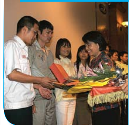
TMV trao giải cho các nhà cung cấp có ý tưởng Kaizen đặc sắc trong hội nghị về quản lý chất lượng lần thứ 7.

Cũng là một trong những hoạt động chú trọng Kaizen, ngày 18/9/2009, tại Hà Nội, TMV tổ chức hội nghị về Quản lý chất lượng lần thứ VII cho các nhà cung cấp, với sự tham dự của Denso Việt Nam, Sumi-Hanel, Yazaki Hải Phòng, Toyota Boshoku Hà Nội, Nippon Paint, Harada, Hà Nội Steel Center, Công ty Công nghiệp chính xác số 1. Đây là một trong những hoạt động thường niên được TMV thực hiện nhằm giúp các nhà cung cấp trao đổi ý tưởng Kaizen mới vào sản xuất thực tế của mỗi công ty, giúp nâng cao hiệu quả công việc bằng những phương pháp đơn giản mà hiệu quả.